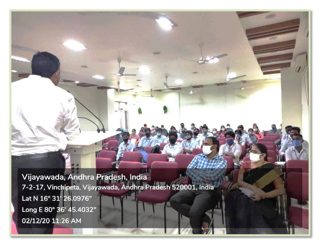
Staff & Students at the Programme